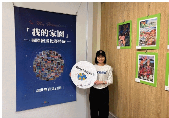
5 月於宜蘭人故事館展出臺灣得獎作品