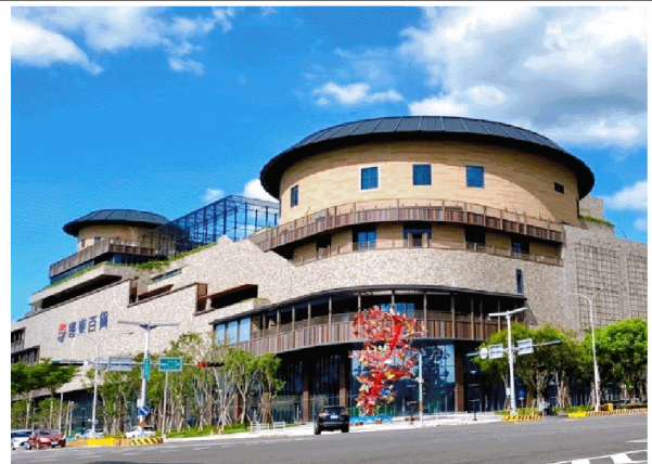
9 月 21 日至 10 月 5 日規畫於 遠東百貨竹北店 8 樓藝文長廊展出