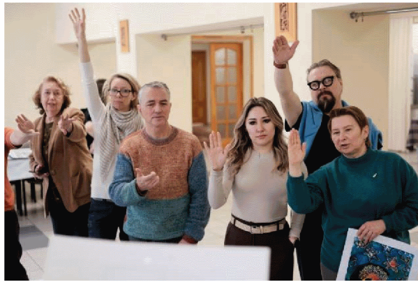
國際評選團評審花絮