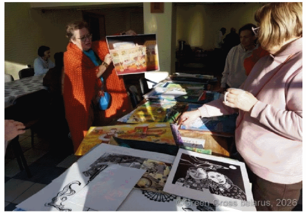
國際評選團評審花絮