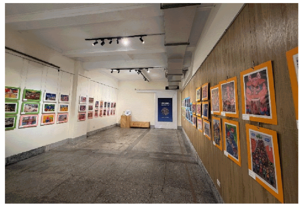
展出臺灣得獎作品