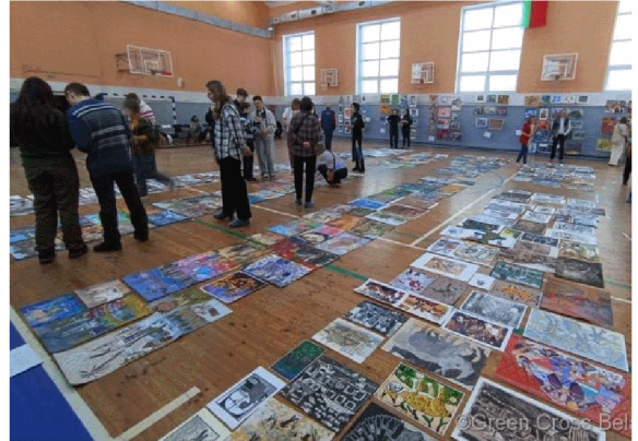
國際評選團評審花絮