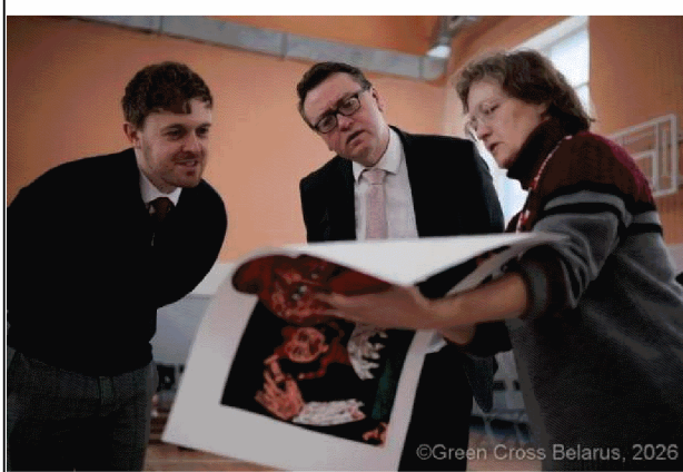
國際評選團評審花絮