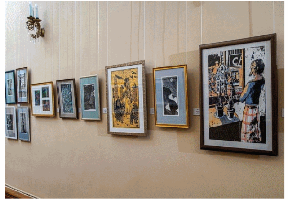
俄羅斯遠東藝術博物館展覽