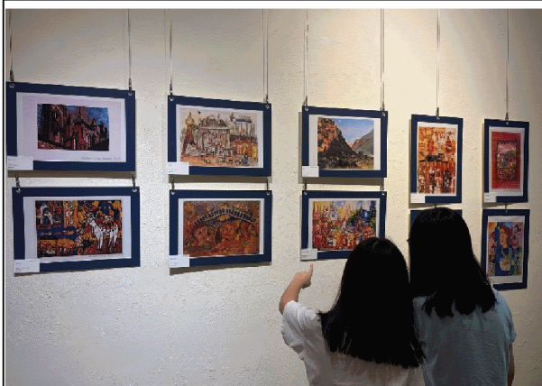
展出部分國外得獎作品