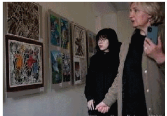
白俄羅斯綠十字生態教育中心展覽