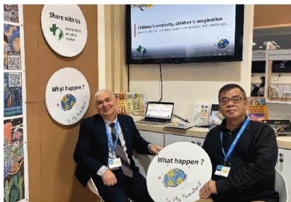
與國際友人分享活動倡議