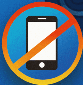
保持專注 遠離手機