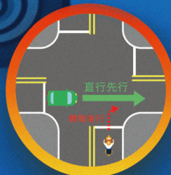
轉彎時 讓直行車先行