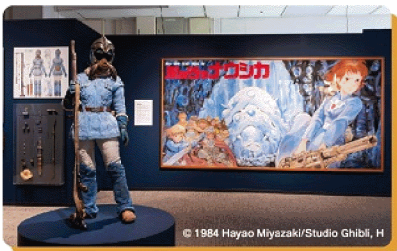
© 1984 Hayao Miyazaki/Studio Ghibli, H