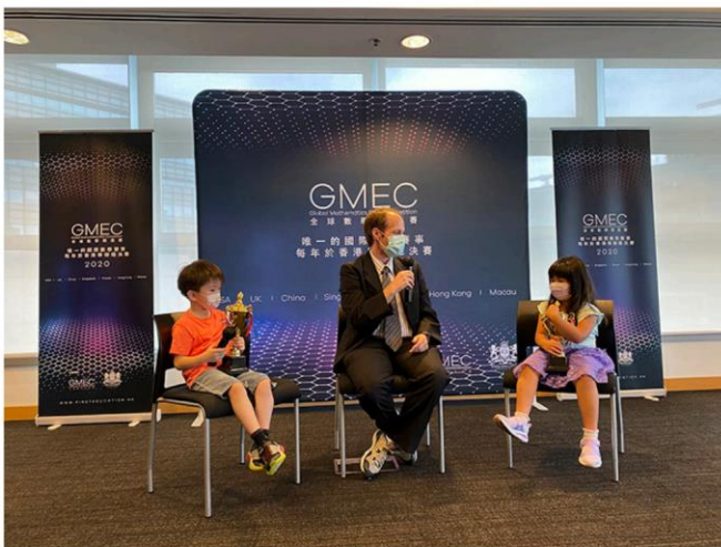
※2020 年 與教授的一席話

2. AoPS 遊學團獎金：全球冠軍將獲得參加 AoPS 遊學團的全額獎學金。（僅包含課程）