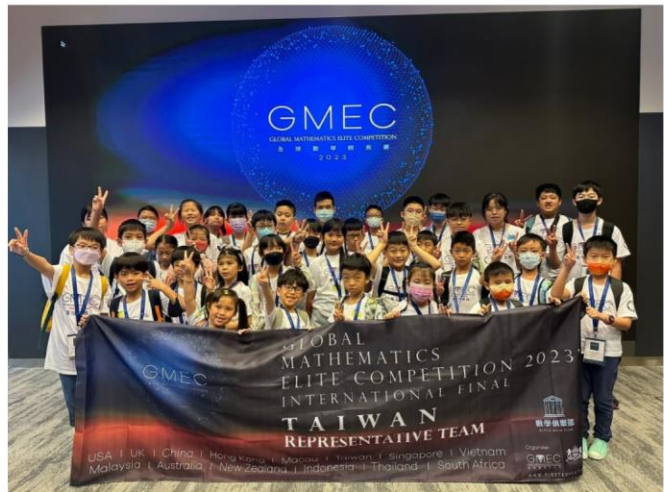
※2023 年 台灣代表隊