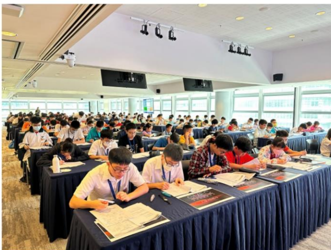
※2023 年 GMEC 總決賽現場