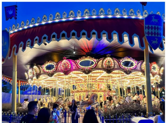
※2023 年 前進香港迪士尼