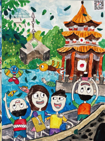
▲ 國小組【第二名】新北市泰山國小 戴子翔