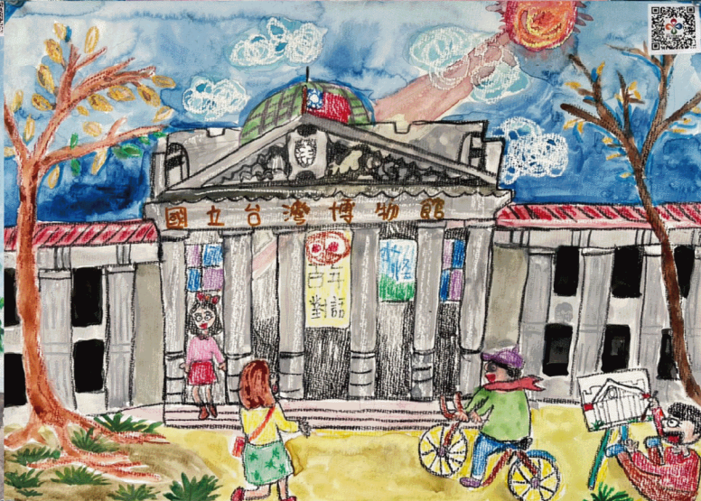
▲ 國小組【第三名】新北市溪洲國小 林芃希