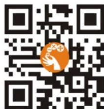
中華數學協會官網