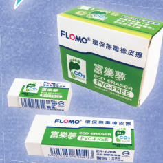
富樂夢 12 色香味彩色筆 環保橡皮擦 5 入分享盒