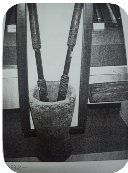
圖為木製餐具組及搗米用的木杵。