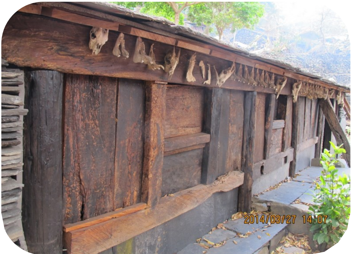
老七佳 tjavucekat 勇士家族家屋

從家屋內大型的祖靈像雕刻，反映了排灣族人對祖靈的崇拜。通常，家裡中柱的雕像是最神聖的地方，放置了許多貴重的物品如陶壺。也掛著刀、獸骨是英勇事蹟炫耀的表徵。