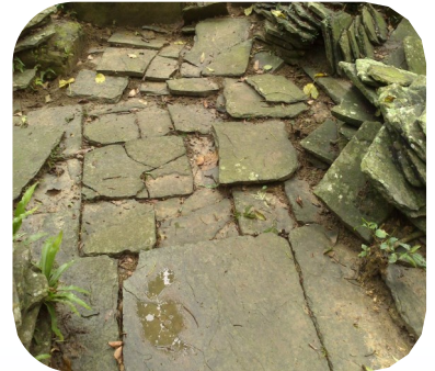
高士部落祖居地遺址 saqacengalj