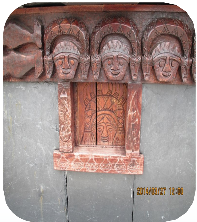
老七佳 cur imudjuq 頭目家屋徽文

貴族家屋出入口的木雕柱、穀倉前的木柱、屋內主柱、屋簷下的桁板及室內的壁板，器具如木箱、木枕、木臼、連杯、針板、佩刀、盾牌及占卜箱等，都是百步蛇圖樣經常出現的地方。貴族被認為是百步蛇的後裔。百步蛇紋是貴族專屬的紋飾，藉以強調統治階級的權威、榮耀與力量。因此，只要從器物衣飾上的紋飾就能清楚地判別身分的不同。百步蛇紋除鞏固貴族神聖的地位外，更具有強化排灣族階級社會結構的功能