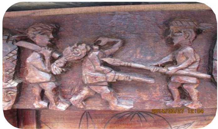
圖為老七佳 qe1udu 頭目家屋門楣雕刻