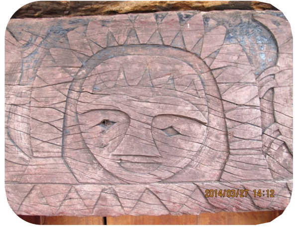
老七佳 qe1udu 頭目家屋徽文

以雕刻來追溯起源或是象徵身份，是排灣族常用的方法，例如他們每一戶人家一進門，在屋子的中間便刻著自己祖先的雕像，清楚地讓別人知道這一家人是誰的後代，雖然光靠雕刻的技巧不能完全清楚地刻劃祖先的輪廓，但是，從特徵上還是可以辨識出來。