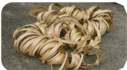
7. 曬乾成束一片片材料