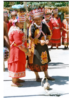
頭目主持祭祀儀式