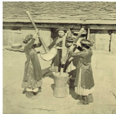
排灣族婦女打小米， 身後為貴族石板屋。

頭目需維持部落的和諧，協調及裁決部落事務。頭目享有特定的家名與人名，而且有專門的家屋裝飾，還有特殊服飾。