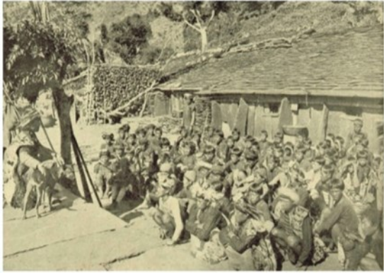
排灣族部落 舉行部落會議