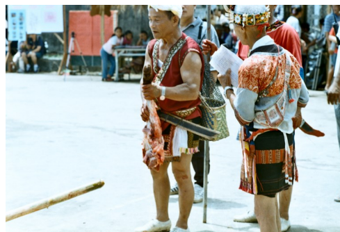
頭目接受平民納貢